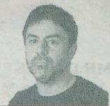
Por ISRAEL VIANA

Se cree que el libertador José de San Martín pudo acceder al documento original escrito por Thomas Maitland en 1799, perdido durante dos siglos en un archivo de Londres, que detallaba los pasos que el Ejército británico debía seguir para lograr la independencia de la América española